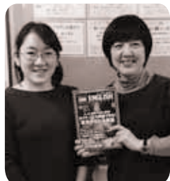
購読をすすめてくれた先生(左)とEEを持ちながら

CNN ENGLISH EXPRESS (EE) の読者に英語学習に関するエピソードを語っていただきます。