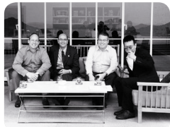
2016年の出張時に職場の仲間と (右)

CNN ENGLISH EXPRESS (EE) の読者に 英語学習に関するエピソードを語っていただきます。