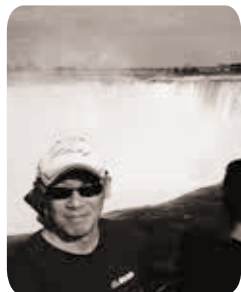
昨夏、カナダに留学中の息子を訪ねて

CNN ENGLISH EXPRESS (EE) の読者に英語学習に関するエピソードを語っていただきます。