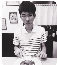
英語以外の趣味は食べ歩き

CNN ENGLISH EXPRESS (EE) の読者に英語学習に関するエピソードを語っていただきます。